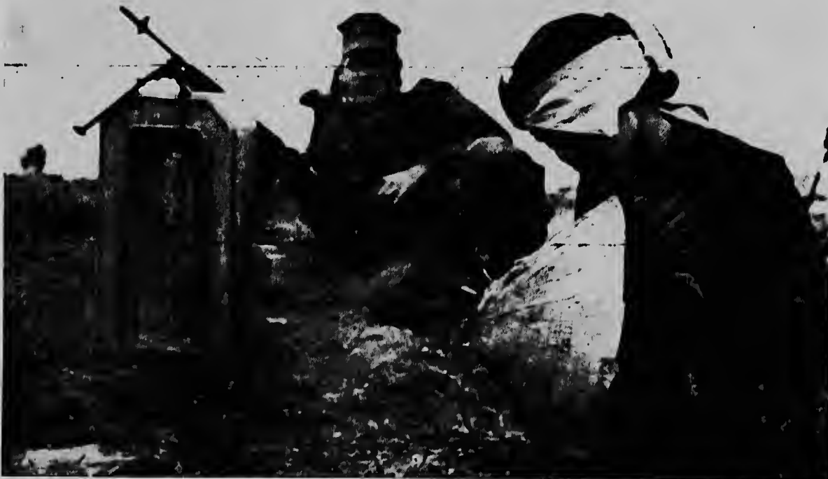
Cu un panja mará na su cara, un muher cu nan ta sospecha por ta un guerrillero di Viet Cong, ta ser vigila door di un soldá mericano despues cu nan a capturele banda di Da Nang, na Sur Viet Nam.